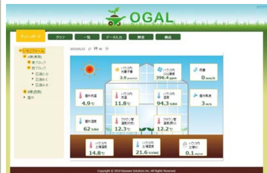
OGAL モニターのダッシュボード画面